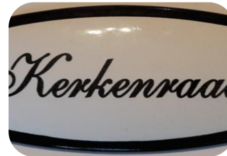
H6 Diaconaal gerelateerde taken binnen de kerkenraad