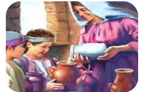
H7 Literatuur en troostrijke woorden