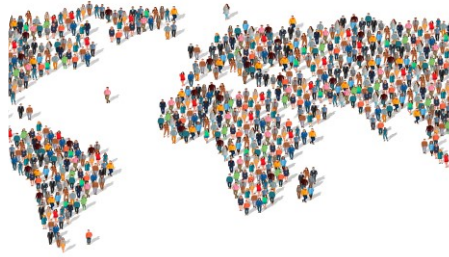
H5 Diaconale ondersteuning buiten de gemeente