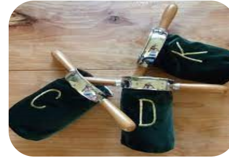
H3 Inzameling en beheer van gelden