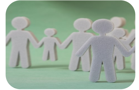
H4 Diaconale ondersteuning binnen de gemeente